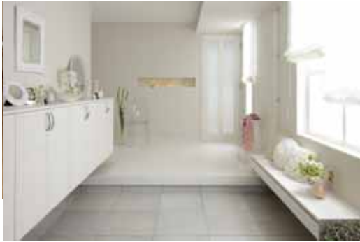
ベリッシュホワイト