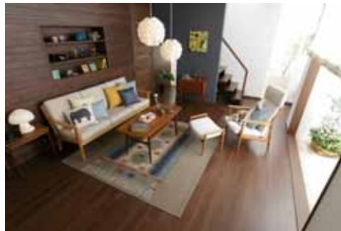
ベリッシュウォルナット