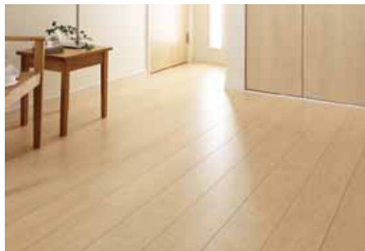
ベリッシュメイプル